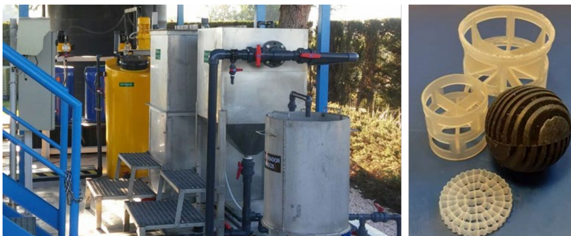
Figura 2. A la izquierda, vista de la etapa aerobia planta piloto Biofungus. A la derecha, diferentes carriers bajo estudio en el reactor aerobio.

El nuevo proceso de depuración se muestra en la Figura 3. En la línea de agua, este cuenta con reactores aerobio MBBR y anóxico independientes para su dosificación por separado de estirpes con diferente especialización. Puesto que ya se comprobó que el rendimiento de depuración descende progresivamente tras la siembra inicial del hongo en el reactor, ahora se plantea el cultivo in-situ y su dosificación periódica para mantener un elevado rendimiento de eliminación de materia orgánica y nutrientes. Se incorpora por tanto al esquema de la planta dos tanques de cultivo con control de pH, temperatura y dosificación de nutrientes. Será objeto del proyecto optimizar las condiciones del cultivo para maximizar su producción y minimizar el consumo energético.